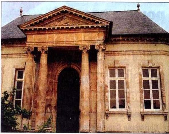
Le temple de Montivilliers attend des dons pour sa rénovation